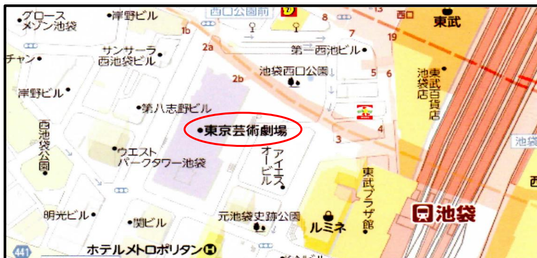
図1 鉄道模型芸術祭・会場(東京芸術劇場)