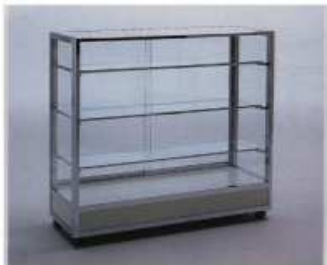
ガラスハイケース W1200×D450×H1500

段数4ですが、最下段は使用しない予定 (暗くなるのを見ずらいため) ただし、ご自身の作品が掲載されている 雑誌などの展示は可能です。